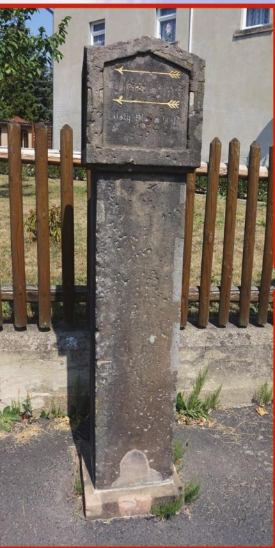
Säule der Hl. Anna